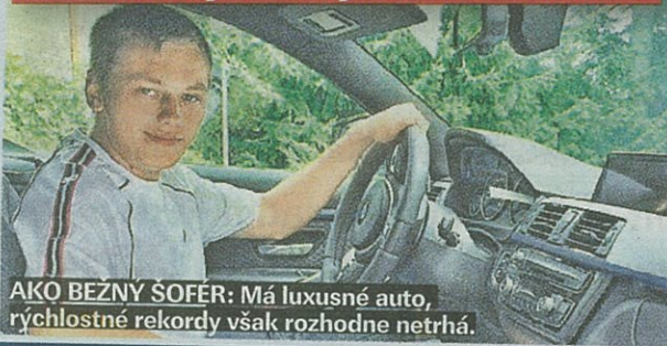
AKO BEŽNÝ ŠOFÉR: Má luxusné auto, rýchlostné rekordy však rozhodne netrhá.