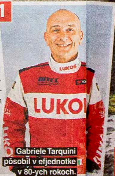
Gabriele Tarquini pôsobil v efjednotke v 80-ych rokoch.